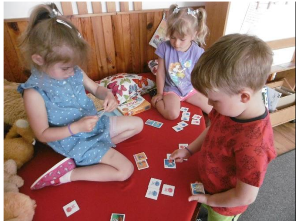
Hledali jsme opaky dvojice obrázků