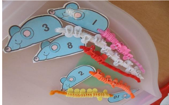
Připínali jsme myškám na ocásky sponky – podle počtu nebo podle barev