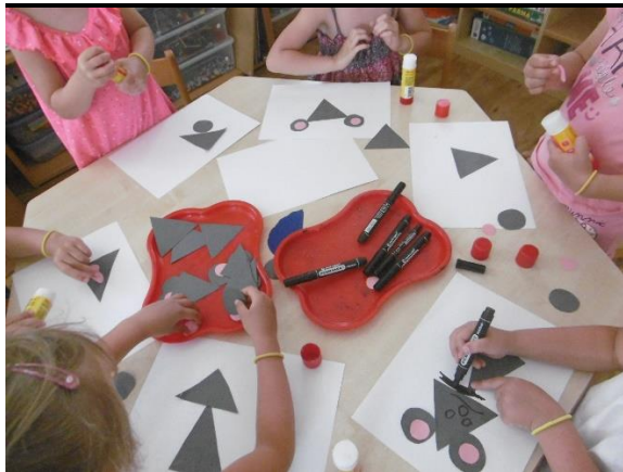
Lepili jsme myšky z papíru – trojúhelníků