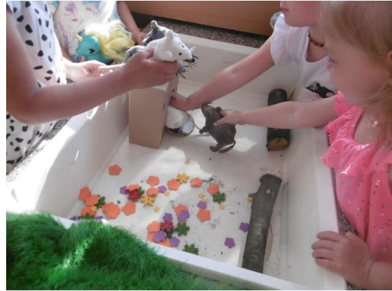
Hráli jsme si s myškami